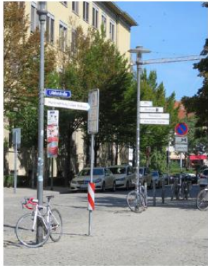
Verteilung der Informationen an einem Standort auf mehrere Masten