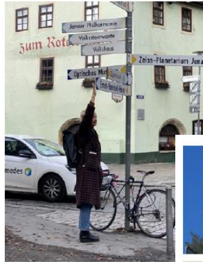
Zu niedrige Anbringungshöhe im direkten Fußgängerbereich