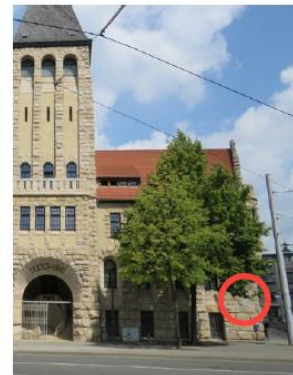
Ungünstige Platzierung, fern vom Eingang, Bezug geht verloren