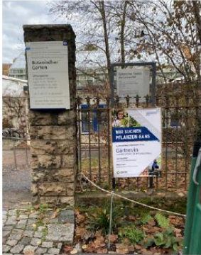
Inhaltliche Doppelungen verschiedener Systeme