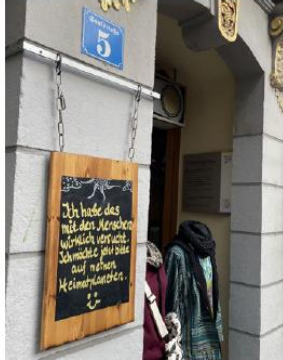
Nicht einsehbar platziert