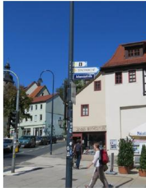
Zu hohe Anbringung – keine barrierefreie Lesehöhe