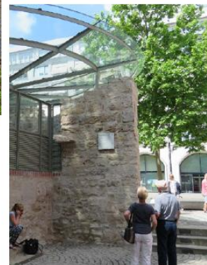
Lesehöhe nicht barrierefrei