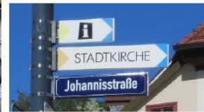
Unterschiedliche Schriftarten und Schriftgrößen (nicht CD-konform)