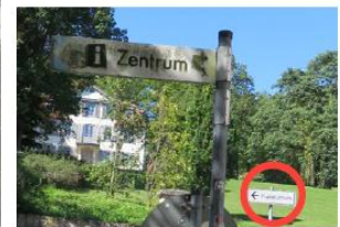
Aufeinandertreffen unterschiedlicher Systeme für verschiedene Zielgruppen (Fußgänger / Autoverkehr)