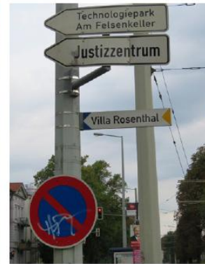
konkurrierende Systeme/Beschilderung für unterschiedliche Zielgruppen