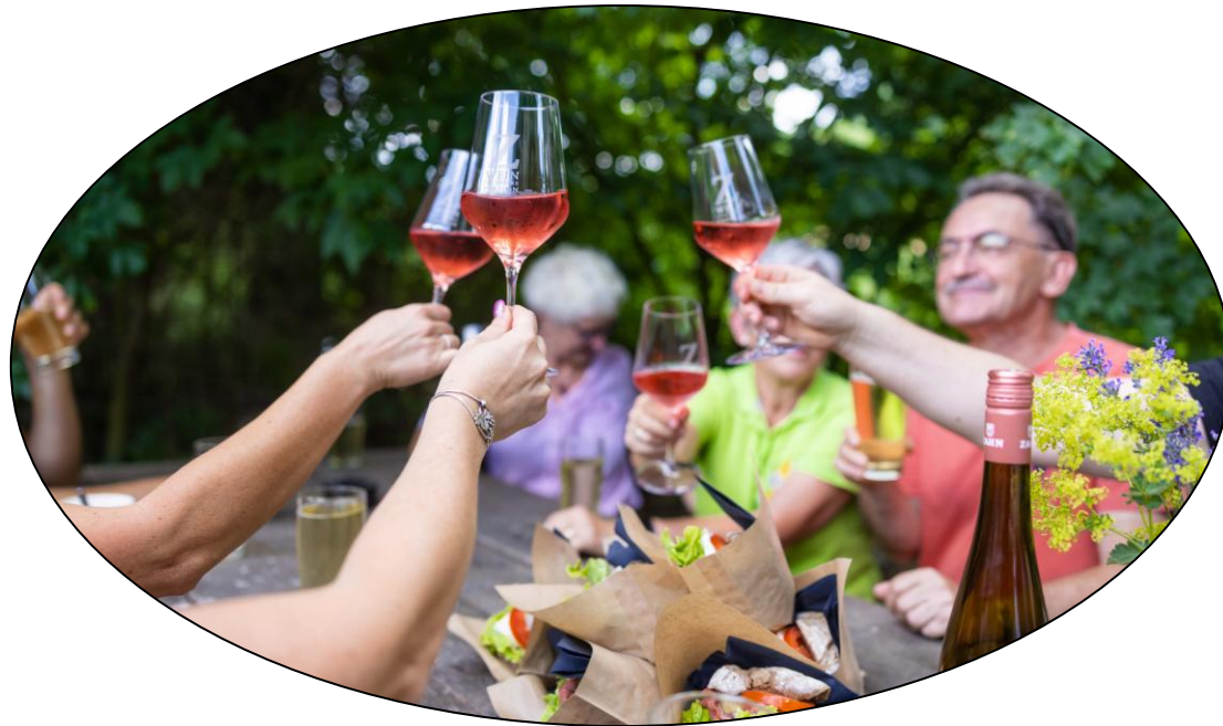
Bad Sulzaer Weinfrühling