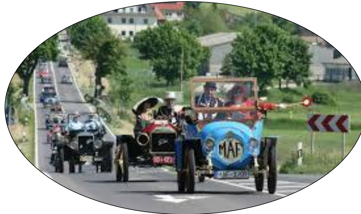
Apoldaer Oldtimer Schlosstreffen