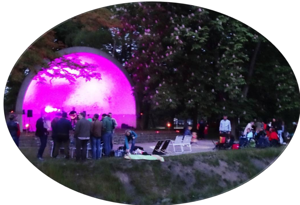
Konzerte und Kinoabende Akustikmuschel