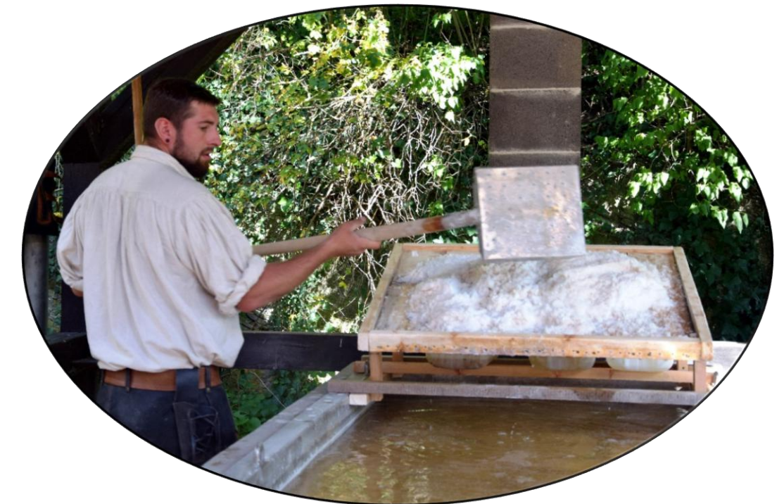
Lange Nacht der Museen mit Schausiederei