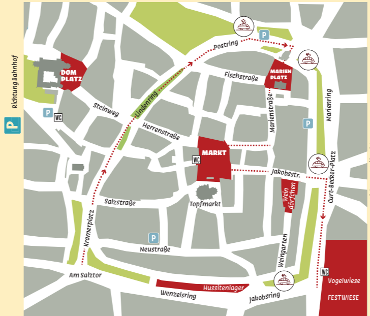
... Verlauf Festumzug

Tourist-Information Markt 6 • 06618 Naumburg • Tel. 03445 273 125 • www.naumburg.de